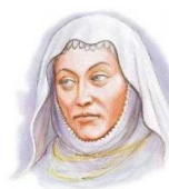
Drahomíra matka Václava