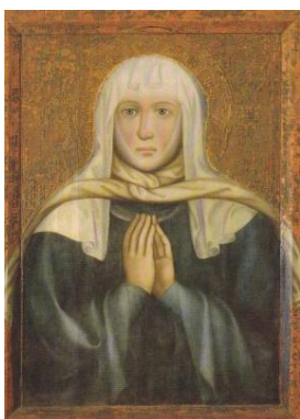
Sv.Ludmila bývá zobrazena se šálou ( šátkem ) kolem krku.