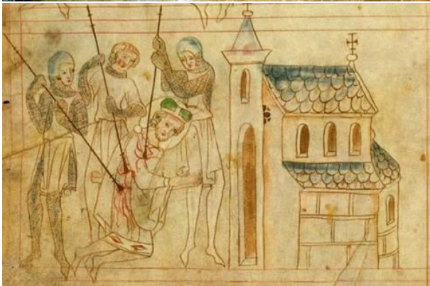
zavraždění Václava u dveří kostela.