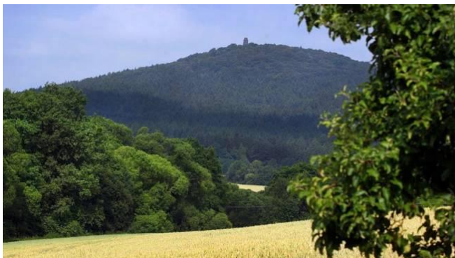
hora Blaník – středočeský kraj u Vlašimy

vysypal celý pytel pod kopcem. V Louňovicích se pak všichni divili, kam kovář na celý rok zmizel. Když pak vyprávěl, co se mu přihodilo, šáhl do pytle a nahmatal tři dukáty. Teprve v tu chvíli poznal, jakou udělal chybu, když pytel vysypal. Honem utíkal k hoře, ale nenašel ani dukáty, ani smetí.