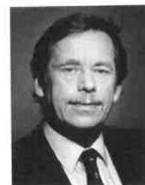
Klement Gottwald – nový prezident od roku 1948