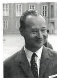
Ludvík Svoboda- československý prezident od roku 1968