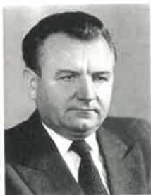
Václav Havel – nový československý prezident po roce 1989